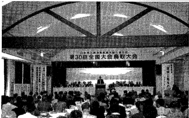
第30回全国大会鳥取大会

問題を中心として課題に向かつて、日資連が率先して業界をリードしていくため、組織の一層の発展が必要である(要約)と述べた。